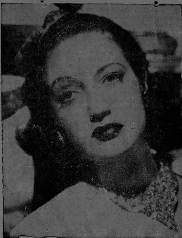
Todos los productos de belleza y todo el arreglo del mundo no serán bastante poderosos para hacerla parecer tan atractiva como DOROTHY LAMOUR, estrella de Paramount, si no duerme bien y el tiempo necesario, afirma Max Factor Jr., el famoso experto de Hollywood.

Hay quien lee para dormirse; pero no se le ocurra leer un libro muy