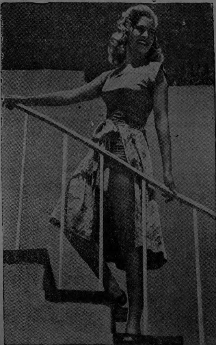
Marilyn Maxwell... actriz de la Metro-Goldwyn-Mayer.

El nombre completo de la rubia y atractiva a quien conocemos como Marilyn Maxwell es: Marvel (que quiere decir Maravilla) Marilyn Maxwell. Pero al comenzar su carrera artística omitió el Marvel por creer que sonaba demasiado teatral. (Pasa a la Pág. SIETE)